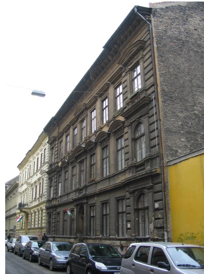
HOMLOKZAT ÁLLAPOTA A FELÚJÍTÁS ELŐTT