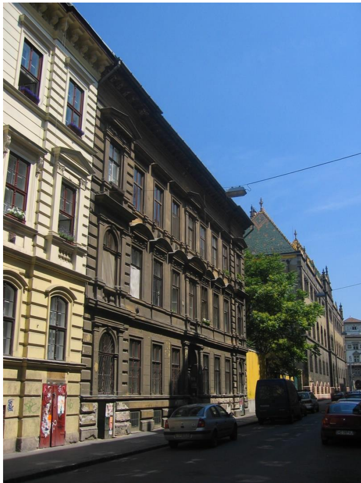
UTCAI NÉZET - ÁTÉPÍTÉS ELŐTT