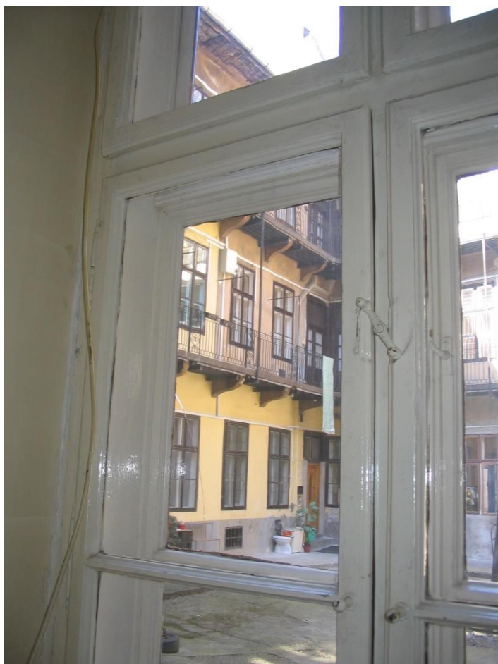
BELSŐ UDVARI NÉZET - ÁTÉPÍTÉS ELŐTT