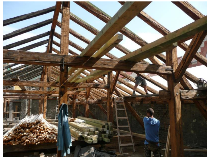
TETŐ FEDELSZÉK FELÚJÍTÁS