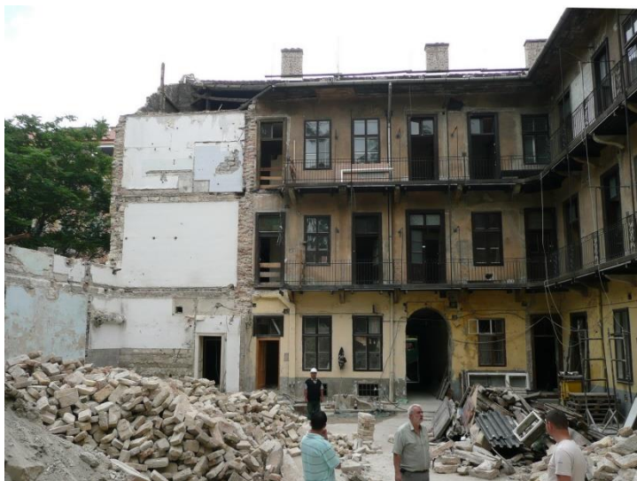
UDVAR NÉZETE A BAL SZÁRNY BONTÁSA ALATT