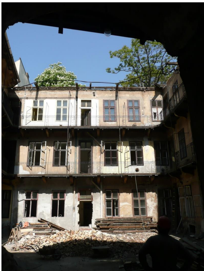
UDVAR A HÁTSÓ ÉPÜLETSZÁNY BONTÁSA ALATT